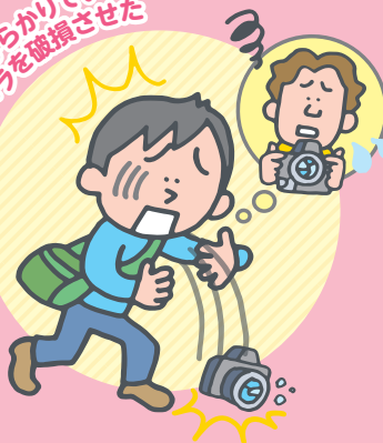
友人からかりているカメラを破損させた