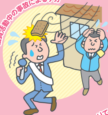
議員活動中の事故によるケガ