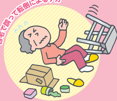
自宅で誤って転倒によるケガ